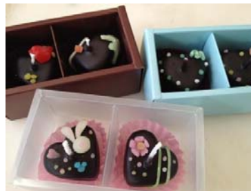
チョコアロマキャンドルのイメージ