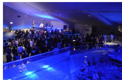
ゲストアーティストによるライブイメージ

商品内容：館内に PENGUIN BAR を設置し、数量限定で『すみだ水族館』オリジナルのクラフトビール「ペンギンビール」を販売します。墨田区の地ビールメーカー「Virgo Beer(ヴィルゴビール)」とのコラボレーションビールです。