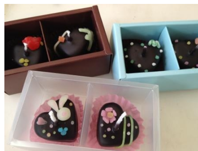
“choc orange” のアロマキャンドルイメージ