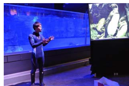
「ペンギンライブ」イメージ