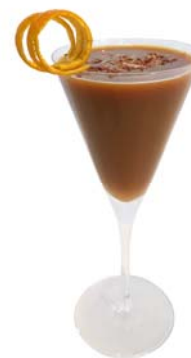
オリジナルチョコレートカクテルイメージ

Air Aroma Japan 株式会社は、香りのブランディングという観点から世界100カ国以上で様々な香りの空間をプロデュースし、ソリューションを提供している、香りマーケティングのバイオニアです。エアアロマ独自の技術「コールドエア・ディフュージョン(冷風拡散技術)」で、香りの安全性や品質を保ったまま香りを拡散します。また、IFRA(国際化粧品香料協会)の厳格な国際基準と規制を遵守し、品質・安全性管理を徹底、グローバル基準で安全性が確認されたフレグランスのみを使用しています。