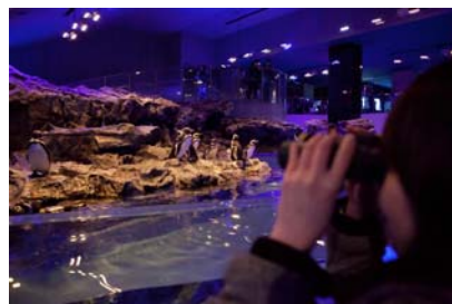
「おやすみペンギンカップル」イメージ

開催日：2016年1月30日(土)～3月14日(月) 開催時間：月～金曜日 18時30分～19時00分 土・日曜日 20時00分～20時30分 ※3月14日(月)のみ20時00分～20時30分 開催場所：すみだステージ、ペンギンプール周辺 参加対象：高校生以上の女性もしくはカップル限定 参加定員：10組20名様 開催内容：夜になり青いライトが灯った館内で、恋するペンギンカップルたちを双眼鏡を使って観察するプログラムです。カップルで寄り添うペンギンたちの幸せな表情を、ゆっくりとお楽しみください。