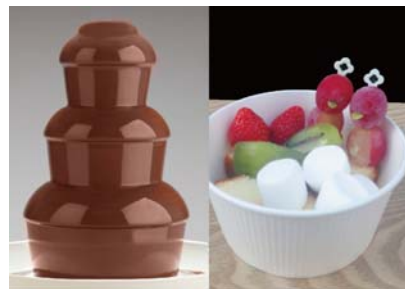
恋するチョコファウンテン

商品内容：冬の寒い季節にぴったりなチョコファウンテンが水族館に登場!ペンギンやオットセイを眺めながら、マシュマロやフルーツと温かいチョコレートと一緒に楽しめます。ブドウで作られた可愛いペンギンも添えられています。カップルでのシェアがおすすめです。