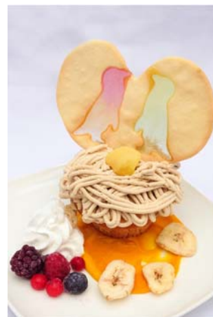
マロンとバナナのペンギンカップルプレート

商品内容：『すみだ水族館』で暮らすペンギンのカップル、オスの「マロン」とメスの「バナナ」にちなんだケーキプレートです。マロンとバナナのカップケーキに、ペンギンカップルのハート型スタンドグラスクッキー(ハートの中をペンギンカップルの形に型抜き、型に餡を入れて焼いたクッキー)を乗せました。「マロン」と「バナナ」の仲の良さを感じられ、見た目も可愛いプレートです。