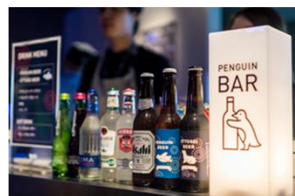
PENGUIN BAR と「ペンギンビール」イメージ