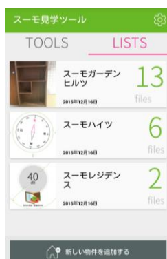
物件ごとに結果を保存