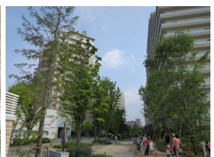
南北遊歩道北側の広場