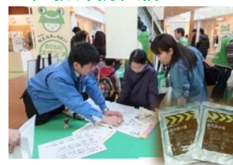
地域防災の様子と非常食用「深川井」

一般的なカンパンなどではなく、江東区では、江東区発祥と言われている「深川井」を非常用として区内で備蓄しています。当日は来場者に配布します。(数に限りがあります。)