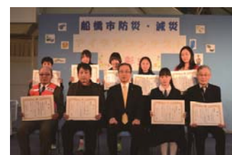
減災アイデアコンテスト

船橋市では日常生活の中で、防災・減災の視点を取り入れたアイデアを募集しました。本イベント内でその入賞者への表彰と作品の展示等を行います。