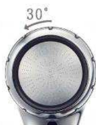
カートリッジの交換は フタを回すだけで簡単