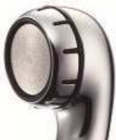
髪や肌をやさしく洗える 当たりのやわらかなステンレス散水板