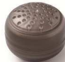
水道水を軟水に変えるだけでなく、 残留塩素の除去も可能な交換式カートリッジ