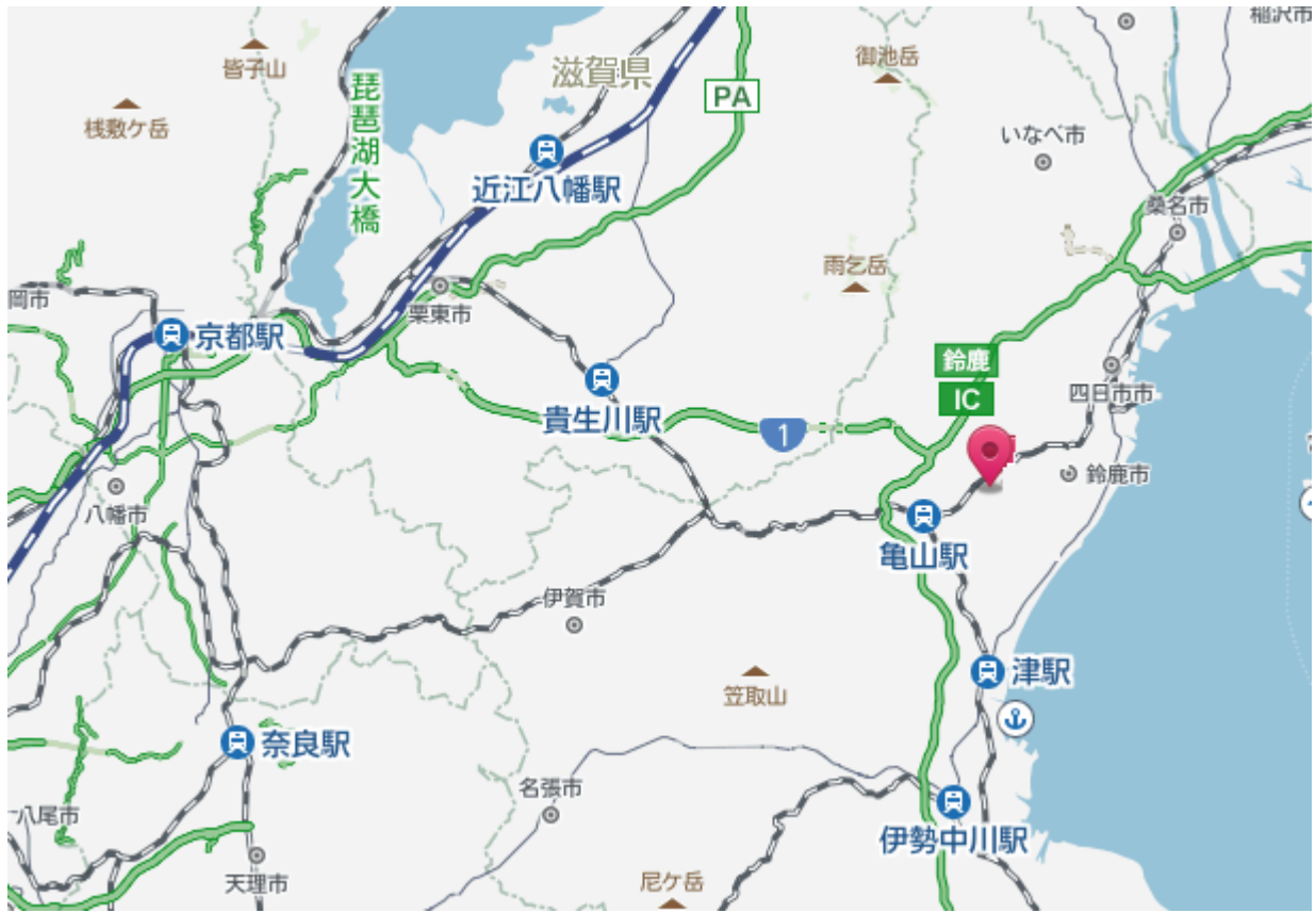
<龍谷ソーラーパーク鈴鹿 設置イメージ 2016年1月現在>