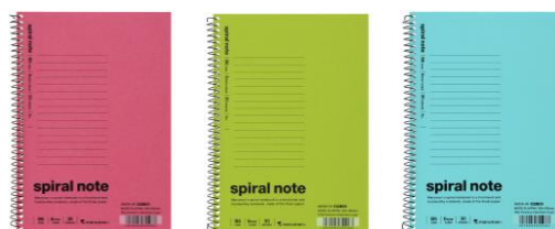
B6 サイズノート 新色 3 冊セット (ピンク、ライトグリーン、ライトブルー)