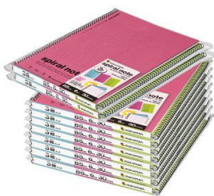
B5 サイズ束ノート 新色 3 冊セット (ピンク、ライトグリーン、ライトブルー)

「オリジナル文具サービス」のページリニューアルを記念して、11月にリニューアルとなった「スパイラルノート」シリーズを6冊セットにしてプレゼントいたします。