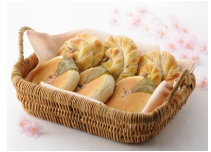
(上) 桜花あんぱん (下) 桜の葉あんぱん

ミルクロールの生地にて、桜餡を練り混ぜ、桜の花の形に焼き上げました。パン生地の優しい甘さと桜餡のほのかな甘みがマッチした春らしいパンです。