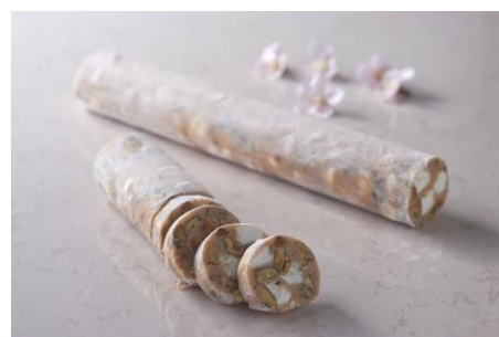
サラーム デイ チョコラート サクラ

まるでサラミのような外観が人気のチョコレートの桜バージョン。桜風味のチョコレートにギモーブやピーカンナッツ、カシューナッツなどのナッツがたっぷり入っています。