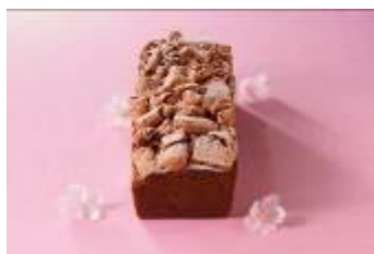
桜パウンドケーキ