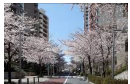
(上) 毛利庭園 (下) 六本木さくら坂