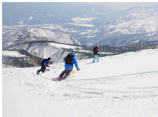
白馬乗鞍岳周辺でバックカントリースキーを楽しむツアーご一行