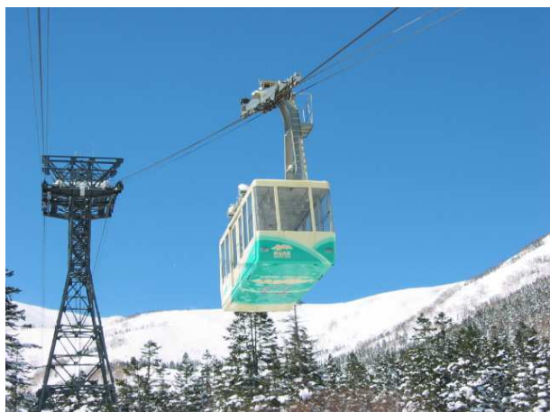
柵池ロープウェイ

今後も、幅広い方々にお楽しみいただける、多彩なアクティビティやサービスの充実化をはかっていきます。