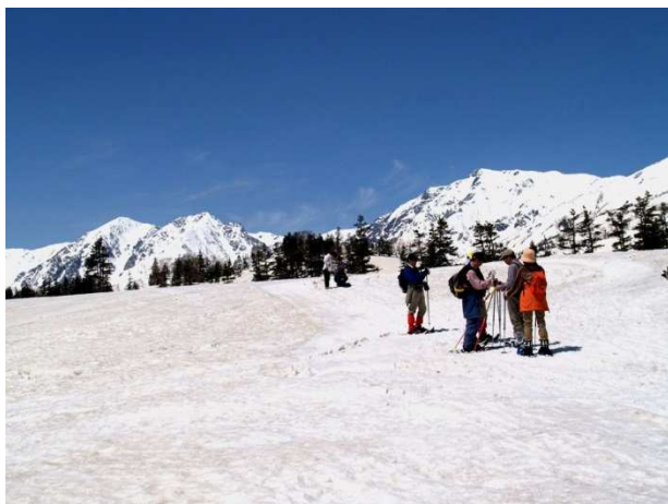
つがいけ自然園でスノーシューを楽しむ様子