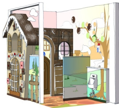
「キッズトイレ」イメージ