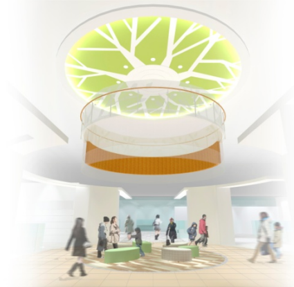
「ひかりの広場」イメージ

また、女性用トイレにベビーシートやおむつ用ごみ箱を増設、3階のキッズトイレは楽しいおとぎの国のイメージにデザインを変更します。ベビールーム(授乳室・オムツ替えスペース)は使いやすい空間レイアウトになり、オムツを替えている間お子さまが退屈しないよう、動物が遊ぶ図柄の壁紙などにリニューアルします。