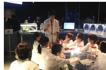
「クラゲ研究員」開催の様子

開催日：3月26日(土)・3月27日(日) 開催時間：各日11時～12時実施予定 募集対象：小学校3年生～6年生 募集定員：1回につき、最大6名 参加方法：すみだ水族館ホームページから事前申し込みが必要です。 応募者多数の場合は抽選となります。 開催内容：飼育スタッフと同じ白衣を着て、クラゲについて研究するプログラムです。クラゲをより身近に感じることができます。