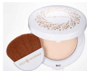
オンリーミネラル ミネラルクール UV フェイスパウダー