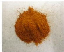
エフェドリンアルカロイド 除去麻黄エキス(EFE)