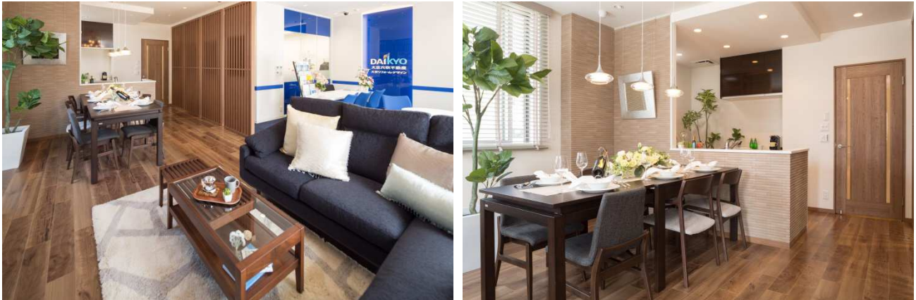
Reno α（リノアルファ）展示ルーム