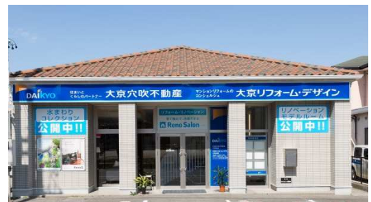
「Reno Salon 三河安城（リノサロン三河安城）」 の外観

大京グループの地域密着型ショールームには、マンション居住者のリフォーム需要として最も多い「水回り（キッチン、浴室、洗面台、トイレ）」を中心に、大手メーカーの実機12点を展示するほか、リノベーション住宅推進協議会の統一基準に基づく厳格な検査・点検を実施した、大京穴吹不動産のリノベーションマンション「Renoα（リノアルファ）」の品質を体感して頂くためのモデルルームを設置し、「Renoα（リノアルファ）」の購入検討者のみならず、ご自宅や購入予定物件のリフォーム検討者にもイメージが湧きやすい空間に仕上げました。