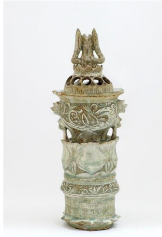
坂口 健「彩刻三島怪獣香炉」