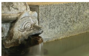
・湯めぐり手形で伊東温泉を満喫

7組限定の伊東 緑涌では、すべてのお部屋に源泉かけ流しの露天風呂が備わり、地元こだわった食事を部屋食でお召し上がりいただき、自室でのエステで身も心も解きほぐされるパッケージプランとなっております。さらに近隣の湯めぐりができる温泉手形を持って三つの旅館の温泉も利用できます。泉質の違う湯めぐりを、お散歩がてらにお楽しみください。また、松川河畔にある大正末期から昭和初期の温泉情緒をいまに残す木造三階建の「東海館」で抹茶セットをお楽しみいただきながら、伊東の古きよき日本を味わえるオールインクルーシブパッケージです。