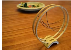
・駿河千筋竹細工