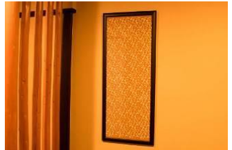
・型染め染色の手ぬぐい