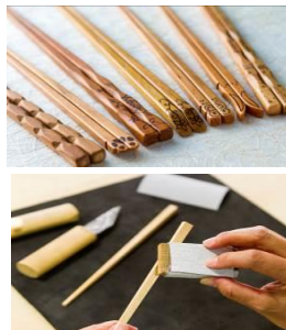
・箸作り体験 (箸屋一膳)