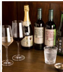
・フリードリンク