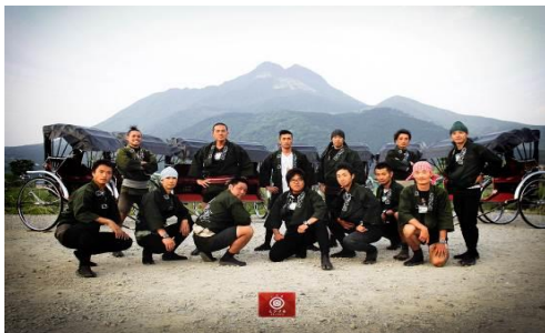
・人力車 (えびす屋湯布院)

地元由布院の観光産業と連携し、近隣観光のアクティビティ「人力車」や由布院の木を使って作る「箸作り体験」などが楽しめるオールインクルーシブパッケージの販売を開始。滞在中のお食事、お飲み物、エステやマッサージまで含まれた贅沢な時間をお過ごしいただき、「地域の魅力に触れる旅行」とすることにより旅行全体の満足度向上や地元の観光産業の活性化を目指してまいります。