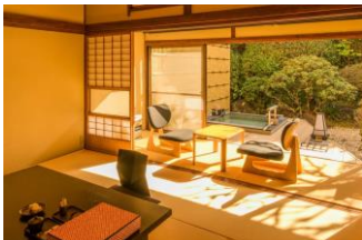
・3/20 リニューアルした客室

お料理を楽しんだ後、プライベート感に満ちた源泉かけ流し庭園露天風呂付客室でゆったりとおくつろぎください。