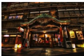
・伊東市指定文化財「東海館」