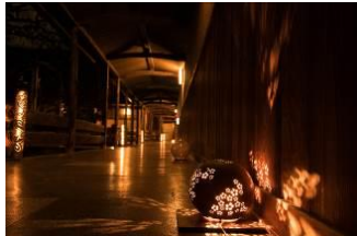
・南大室釜のあかり