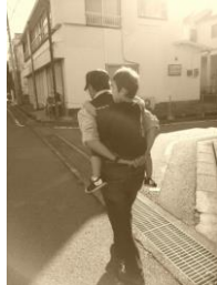
「最後の孫のおんぶ」