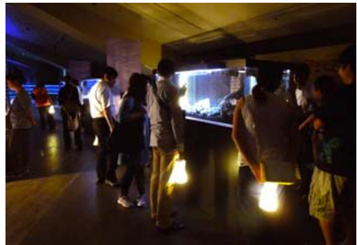
LEDランタンの明かりで照らされた「江戸リウム」