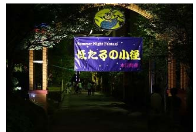
「ほたるの小径」 昨年の開催風景