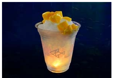
「ほたるのひかりカキ氷」

商品内容：夕暮れの清流で光るホタルをイメージしたカキ氷。みぞれシロップとマンゴーゼリーで仕上げました。焼酎が入った大人向けのカキ氷650円(税込)も販売します。