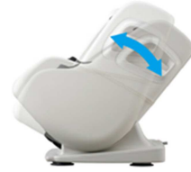
スライド角度調節

本体右側にある角度調節ハンドルでお好みの角度に調節できますので、楽な姿勢でお使いいただけます。