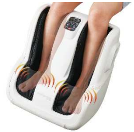
足裏すっきりバイブ

リズミカルな「リフレッシュコース」、もみ動作の速い「ハードコース」、ゆったりとした「リラックスコース」、お手軽な5分間の「クイックコース」を搭載しています。 ※クイックコース以外は15分間のコースです。