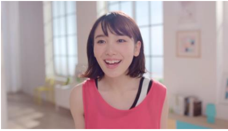
女子旅の準備はいい？