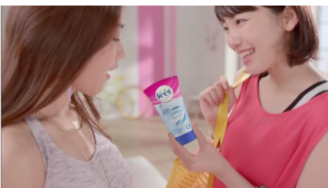
じゃあ、これ使ってみて！