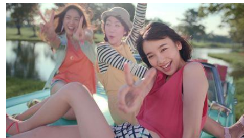
ヴィートで女子ろう！