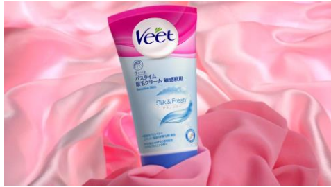
ヴィート シルク&フレッシュなら