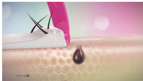
ムダ毛を取り除くから