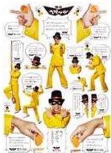
店舗内に掲示している「怪盗ナゲッツ」の小型ステッカー