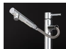
引き出して使えるハンドシャワー