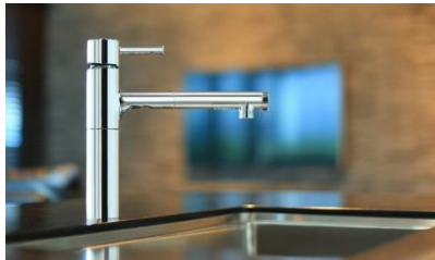
エコ・機能性・デザイン性を兼ね備えた ビルトイン型浄水器《クリンスイ F904C1》

三菱レイヨン株式会社(本社:東京都千代田区、社長:越智仁)のグループ会社である、浄水器、医療用水処理装置の販売を行う三菱レイヨン・クリンスイ株式会社(本社:東京都品川区、社長:池田宏樹 以下、当社)は、高い浄水能力と機能性はそのままに、シングルレバーで吐水・止水、湯・混合水・水・浄水の切替が簡単にできる「使いやすさ」をより重視した、ビルトイン型浄水器のエコモデル《クリンスイ ※1 F904C1》を6月下旬より全国にて新発売します。