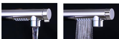
ストレート吐水画像(左)、シャワー吐水画像(右)

吐水口先端の切替レバーをまわしてストレートとシャワーを簡単に切り替え可能。広がりのあるシャワーは当たり面が大きく、鍋やまな板などをサッと洗い流すことができます。また、浄水でシャワー吐水ができ、野菜を洗うときなどにも便利です。