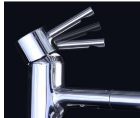
シングルレバーで湯・混合水・水・浄水の簡単操作が可能となった クリンスイ独自の3WAYレバー