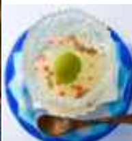
＜初実施＞金魚スイーツさんぽ