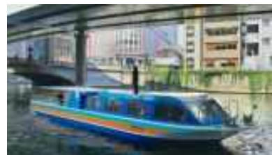
小型水上バス「カワセミ」

期 間：7月10日(日)～9月22日(木・祝)の17日間(39便) コ ー ス：日本橋船着場～日本橋川～隅田川～神田川 料 金：大人2,060円／小学生1,030円(税込) 問 合 せ 先： http://www.tokyo-park.or.jp/waterbus/