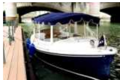
音が静かな電気ボート