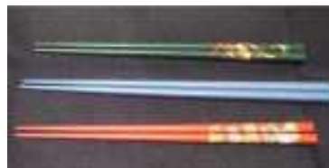
日本橋 箸長 (コレド室町3)