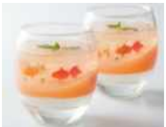
(グルメショップ by マンダリン オリエンタル 東京) 金魚が可愛いグレープゼリーとパッションフルーツ味のエクレア