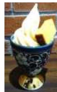
ゆかた・アートアクアリウム チケット特典