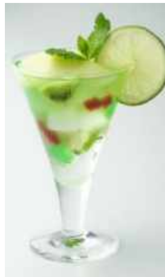
(BUNMEIDO CAFE) 色つき寒天を水草と金魚に見立てた自家製桃&メロンゼリー!