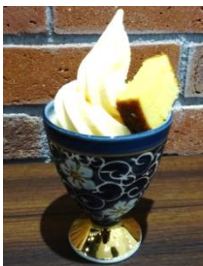
日本橋 長崎館 (アンテナショップ)