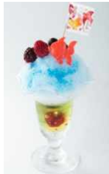
(わなびば KITCHEN333) 水色の氷にのった金魚が可愛いカキ氷!