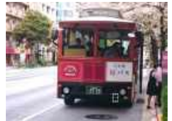
「日本橋 桜フェスティバル」実施時の様子

期 間：7月23日(土)～8月28日(日)のうち土・日・祝日 運行場所：日本橋地域 各エリア 乗車場5ヶ所/コレド室町・日本橋三越前、浜町公園・明治座前、人形町・甘酒横丁、日本橋高島屋前、東京駅八重洲口 ※人形町・甘酒横丁と東京駅八重洲口は、降車のみ可能 運行時間：11:00～17:00 運行車両：トロリーバス1台 価 格：無料