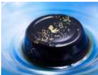
(箔座日本橋) 金魚型の食べる金箔と珈琲ゼリー!

期 間：7月8日(金)~9月25日(日) 参加店舗：約55店舗 (5月31日時点) ※詳細はP9店舗一覧参照 銘メニュー例：※メニュー名・商品画像は全て予定です。