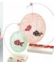
金魚グッズも販売 ※画像はイメージです