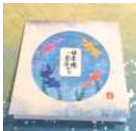
小津和紙 (和紙販売店)