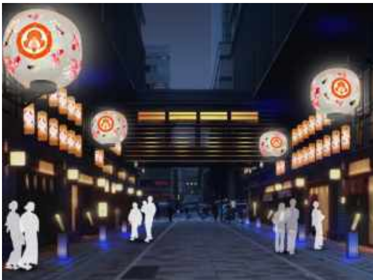
＜初実施＞金魚大提灯で彩られる仲通り

今年にはECO EDO 日本橋実施期間中7～8月の土日限定で、金魚を販売する「金魚屋台」を初めて実施。江戸時代より金魚を愛でる文化が根付く日本橋で、当時の街の風景が蘇ります。