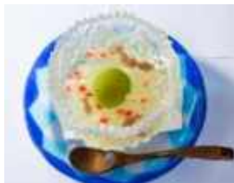
(日本橋 舟寿し) 羊羹でつくった金魚が泳ぐ梅ゼリー!