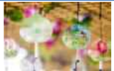
金魚風鈴イメージ

期 間：7月8日(金)～9月25日(日) 参加店舗：165店舗(5月30日時点)