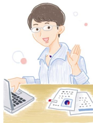
著者中河内いづみイメージ

※著者名は、三井不動産株式会社ビルディング本部に所属する執筆者3名の名前から合成したペンネームです。