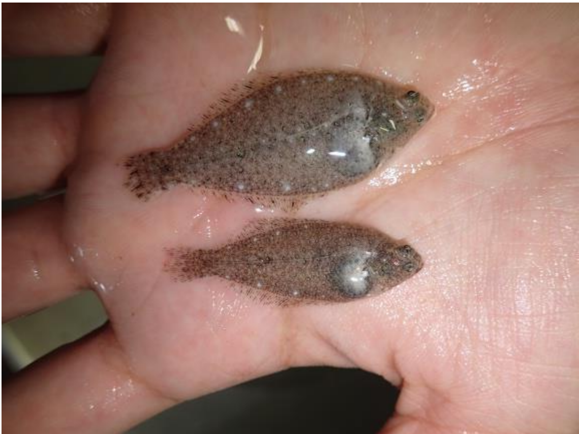
写真3 緑色 LED 光照射のマコガレイ（上）と LED 光を照射していないマコガレイ（下）