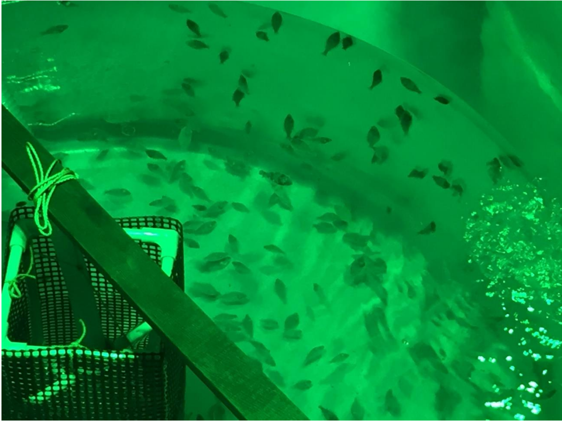
写真2 飼育実験中のマコガレイ