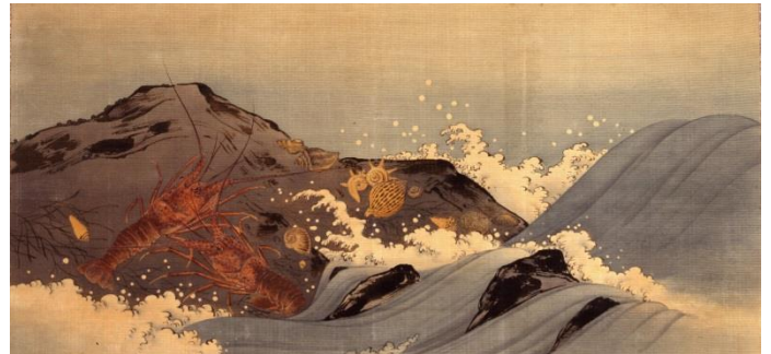
「貝に海老図」ピロード友禅 村上嘉兵衛 (明治時代) 後期展示