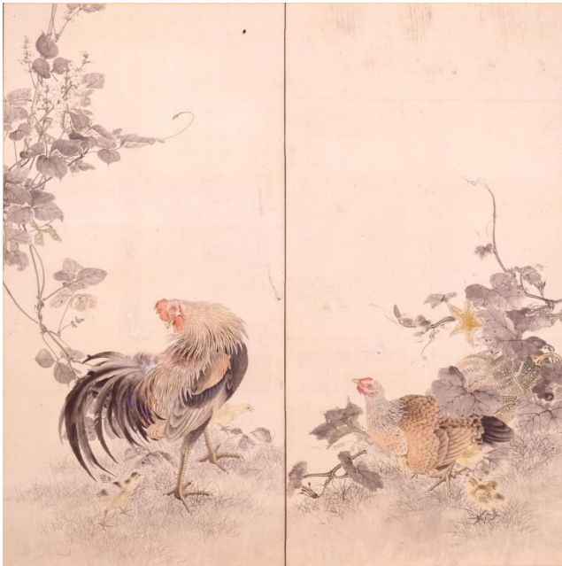
「南瓜・豆に鶏図」下絵 今尾景年 (明治時代中期) 前期展示