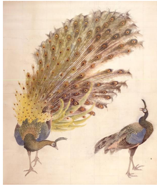
「孔雀図」 荒木寛畝原画、上田萬秋写 (明治37年頃) 前期展示