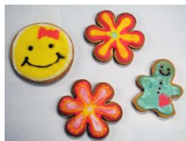
※アイシングクッキー イメージ

パン作りでは、太閤園シェフが予め準備した生地に好きな具材を入れたり、好きなかたちに成形体験ができます。今年はパン作りだけでなく、新たに、今人気のアイシングクッキーのデコレーション体験もできます。こちらも太閤園シェフが予め焼いて用意したクッキーにアイシングでお絵かきをするもので、シェフの指導のもと初心者でも簡単に楽しく体験いただけます。