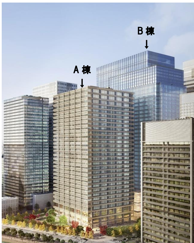
皇居側より計画地を望む