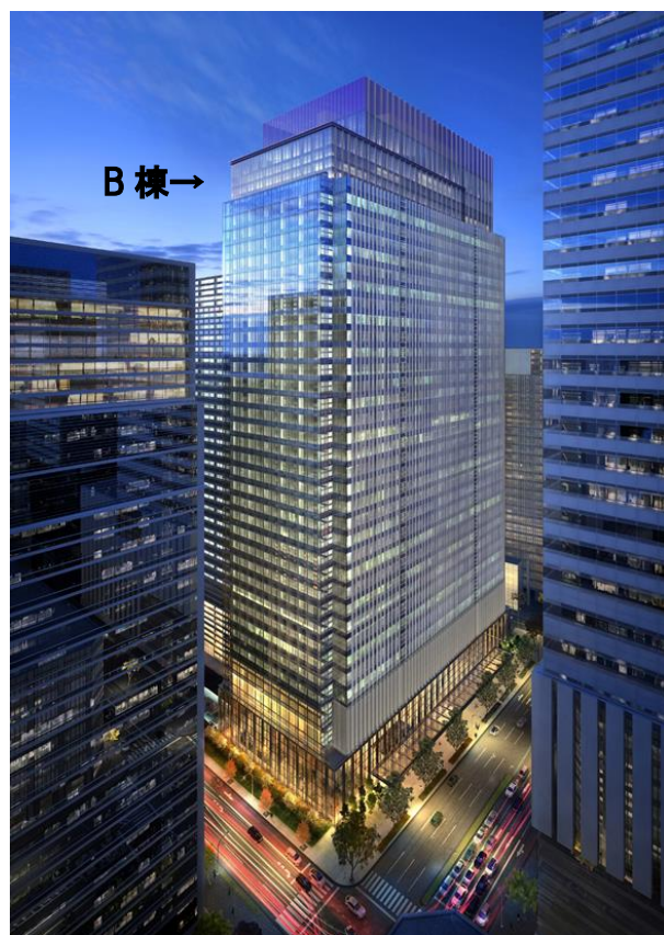
日比谷通り側よりB棟を望む

※B棟の主に高層階部分(3階、34~39階)に「フォーシーズンズホテル」が出店いたします。