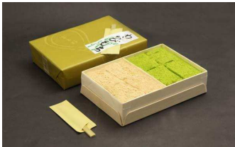
わらび餅詰合せ 1,000 円

ふるふる柔らかな食感。まろやかな香川県産和三盆糖を使用した「讃岐」と、京都宇治の抹茶を贅沢に練り込み、きな粉にも抹茶を合わせた「宇治」の詰め合わせ。