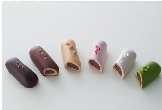
ふゆうじょん(6 個入り) 1,200 円

創業 380 余年の老舗が、“次世代につなぐ和菓子”を提案。餡たっぷりの焼き菓子とチョコレートのアンサンブル。