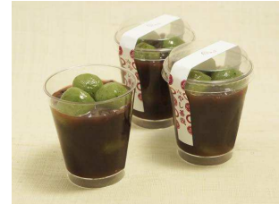
冷やし善哉 300 円

北海道産の小豆を使用した粒餡に、もちもちの蓬団子が 6 玉入った食べ応えのしっかりある冷やし善哉。