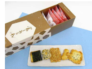
寛々あられ(大) 1,000 円

赤坂柿山が立ち上げたブランド。こだわりのもち米を使った人気のおかき 5 種類をセレクトした詰め合わせ。