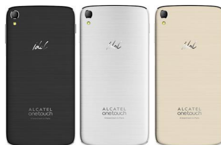
<ダークグレー> <メタリックシルバー> <ソフトゴールド>