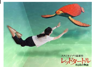
フォトロケーション イメージ