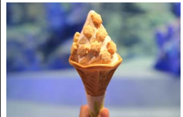
ウミガメの赤ちゃんソフトクリーム

販売内容：小笠原のシーソルトを使用した塩バニラソフトクリームに、ウミガメの赤ちゃんの形をしたサクサクのサブリングしました。