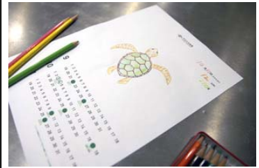
ウミガメカレンダー

開催内容：カレンダーにウミガメの甲羅スタンプを押して、ウミガメの顔や足の絵を描き、好きな色を塗ってオリジナルカレンダーが作れます。すみだ水族館で日々大きくなっていくウミガメの赤ちゃんの成長記録も楽しむことができる体験プログラムです。