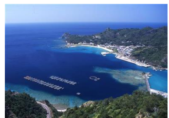
世界自然遺産 小笠原諸島

すみだ水族館は、東京唯一の世界自然遺産である小笠原諸島の魅力を伝えるため、2012年の開業時より小笠原村と提携し、展示づくりやイベントを行ってきました。小笠原諸島は国内最大のアオウミガメの産卵地の一つで、現地での保全・放流活動が行われています。『すみだ水族館』は小笠原の活動に賛同し、お客さまにかわいらしい姿や希少性を伝えるため、2012年より、毎年小笠原諸島で生まれたアオウミガメの赤ちゃんをお預かりし、約1年間育て小笠原諸島の海へ放流する活動を続けています。