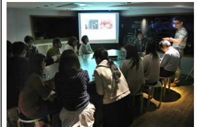
小笠原アカデミー ～ゆうゆうオガサワラ～

開催内容：小笠原村観光局員とすみだ水族館の飼育スタッフによる小笠原の自然・文化やウミガメに関する旬な話題を、特産品であるラム酒を味わいながらお楽しみいただけます。まるで小笠原にいるかのような、ゆうゆうとした時間を過ごす大人向けプログラムです。