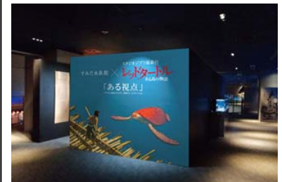
特別展示コーナー イメージ

スタジオジブリ最新作 すみだ水族館 × レッドタートル ある島の物語 「ある視点」 すみだ水族館からみた、映画『レッドタートル』