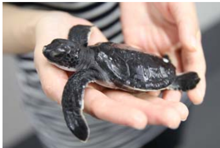
アオウミガメの赤ちゃん