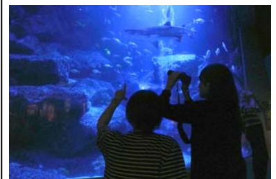
ブルーナイトダイビング

開催内容：小笠原諸島の海を再現した「東京大水槽」を双眼鏡を使ってじっくり観察するプログラムです。ウミガメが見ている海のように、視界いっぱい青い世界が広がります。魚たちのかわいらしい個性や性格について飼育スタッフならではの視点で解説し、いきものが身近に感じられます。