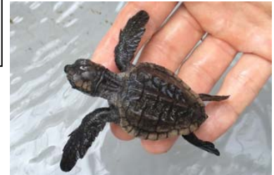
アカウミガメの赤ちゃん