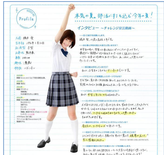
橋本愛さんのニューコン宣言画面

橋本 愛 生年月日:1996年1月12日 出身地:熊本県 09年「Give and Go」で初出演初主演。 10年「告白」で美月役を演じ注目を集める。 11年「アバター」主演、「管制塔」主演、「大木家のたのしい旅行」、12年「HOME 愛しの座敷わらし」、「BLOOD-C」、「貞子3D」、「スープ」7/7公開、「Another アナザー」主演8/4公開、「桐島、部活やめるってよ」ヒロイン8/11公開、「ツナグ」10/6公開 <ドラマ> 12年 NHK「はつ恋」など <雑誌> Seventeen 専属モデル