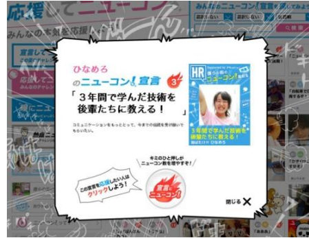
『応援してニューコン』画面