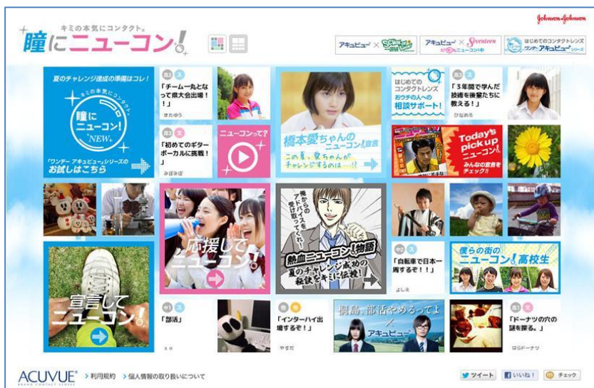
「キミの本気をはじめよう。瞳にニューコン！」ウェブサイト TOP 画面

コンタクトレンズを使い始める時期について聞いた調査では、中学、高校で9割という結果が出ており、そのきっかけを“スポーツ”と答えています。実際に、彼らの8割以上が何かしらの部活動に参加していることも分かっています*1。「アキュビュー」は、そんな中高生の(NEW)コンタクトレンズでチャレンジする姿をサポートします。