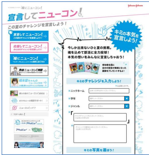
『宣言してニューコン』画面

「ニューコン宣言」と一緒に画像を投稿すると、雑誌「Seventeen」や「HR」の表紙デザインに、宣言と画像がデザインされ、人気雑誌の表紙に自分が登場したようなオリジナル画像ができあがります。表紙風の画像は、ソーシャルメディア(Facebook/Twitter/mixi)を通じて友達に知らせたり、プロフィールアイコンのサイズに合わせてダウンロードすることができます。また、『応援してニューコン！』では、投稿された「ニューコン宣言」の中から、共感したものに“ニューコンボタン”を押して応援することができます。検索機能もあり、同じ部活の人の宣言を見ることが可能です。