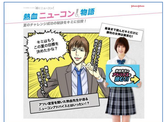
『熱血ニューコン！物語』画面

初めてのコンタクトレンズで分からないことや不安なこと、気をつけたいことなどを、コミック形式で楽しみながら学び、解消するサポートをいたします。『熱血ニューコン！物語』を最後まで読むと、『宣言してニューコン』で生成された、「Seventeen」、「HR」などの雑誌オリジナル表紙がもらえ、携帯の待ち受けにして保存できます。