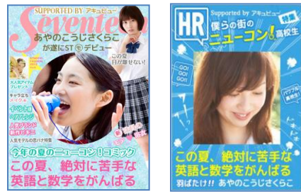
Seventeen、HR 風のオリジナル表紙