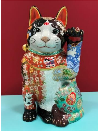
九谷ヌーボーの作品

幸せを招いてくれる招き猫と招き猫モチーフのグッズが大集合。豪華な九谷ヌーボーや瀬戸ヌーボー、作家作品、黄金の招き猫から、手軽にお求めいただける小さな招き猫まで様々な種類を取り揃えました。招き猫モチーフの文具、雑貨も各種販売いたします。