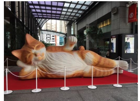
新宿高島屋 2階 JR口前広場の「涅槃大招き猫」