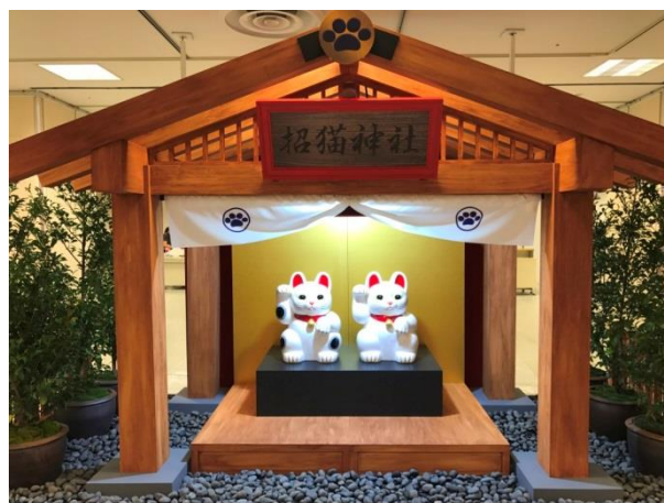
新宿高島屋 11階催会場 招猫神社

現在今戸神社には2体の大きな招き猫が本殿に鎮座されています。そこで今回会場には「招猫神社」を設置し、その神社の中に高さ約60cmの招き猫を2体展示し、お客様をお迎えます。初日21日(水)午前11時より今戸神社 神主による祈祷式を行います。縁結び神社としても知られる今戸神社だけに、新宿高島屋が縁結びの新パワースポットになるかも?!今戸神社で販売されている、巫女姿の招き猫がかわいいオリジナルのおみくじも特別販売いたします。(1枚200円(税込)・300枚限り)