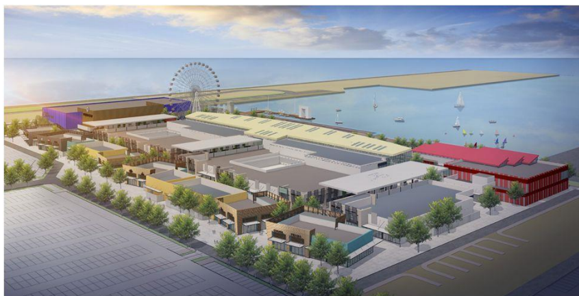
完成予想鳥瞰パース

今年1月に開業し好調に推移している「三井アウトレットパーク 台湾林口」での経験を生かして日系店舗を積極的に誘致するなど、当社グループの100を超える国内外の商業施設での開発・リーシング・運営により培ったノウハウを最大限に活かしてまいります。