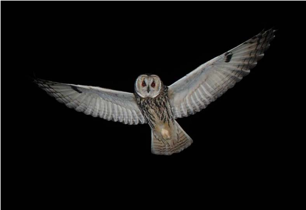
写真1 トラフズク（無断転載禁止）

全長 38 cmの夜行性フクロウ類。北海道・本州の一部で繁殖し，冬季は全国的に見られる。 夜間に開けた農耕地や草地で主にネズミ類を狩る。