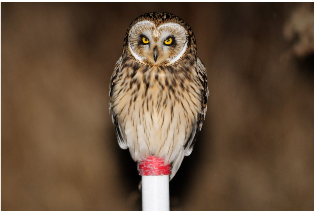
写真2 コミミズク（無断転載禁止）

全長 38 cmの夜行性フクロウ類。北海道・本州の一部で繁殖し，冬季は全国的に見られる。 夜間に開けた農耕地や草地で主にネズミ類を狩る。