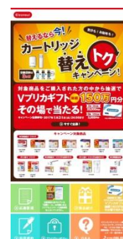
「替えるなら今！カートリッジ替えトクキャンペーン」 キャンペーンPOP(左)と、キャンペーンシール(中)、キャンペーンサイト(右)