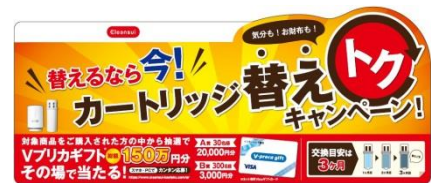
「替えるなら今！カートリッジ替えトクキャンペーン」店頭POP

本キャンペーンでは、対象商品購入者の中から抽選で330名様に、ネット専用Visaギフトカード「Vプリカギフト」を総額150万円分プレゼントいたします。商品についてのシリアルナンバーを使ってスマートフォンやパソコンから応募する「その場で当たる」キャンペーンで、お客様のカートリッジ交換への関心を高める狙いです。