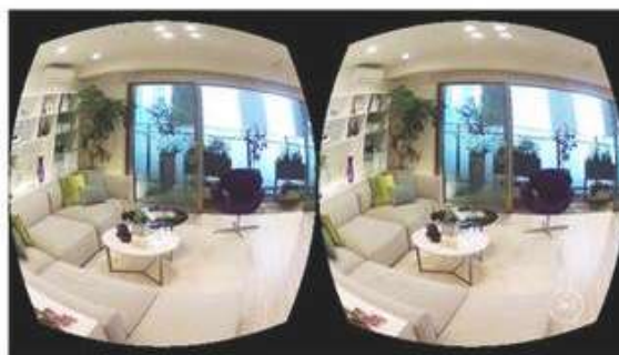
映像（モデルルーム室内）