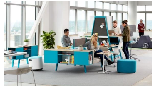
座る・立つ・動くという姿勢が促されるオフィスデザイン