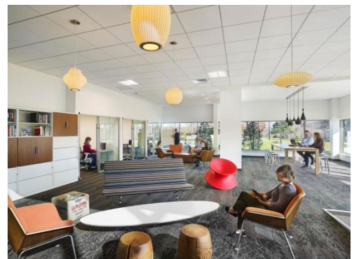
業務内容に合わせた場所を自由に選べるフレキシビリティも重要な要素

但し、全ての要素がどの企業にも向いているとは思いません。各企業の生い立ちや、文化、事業内容は異なります。8つの要素は、企業によってプライオリティは同一ではなく、各企業の働き方に合った、オフィスの形とその使い方を考えることが重要です。