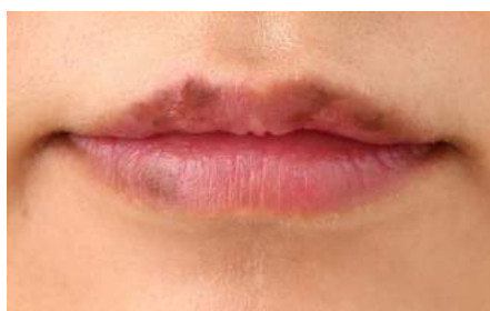
黒ずみとくすみによる不健康な唇

■美唇姫ナイトパック EC サイト： http://nonplex.jp/item/1471