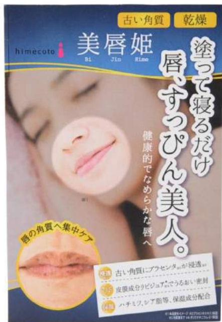
美唇姫(びじんひめ) パッケージ画像