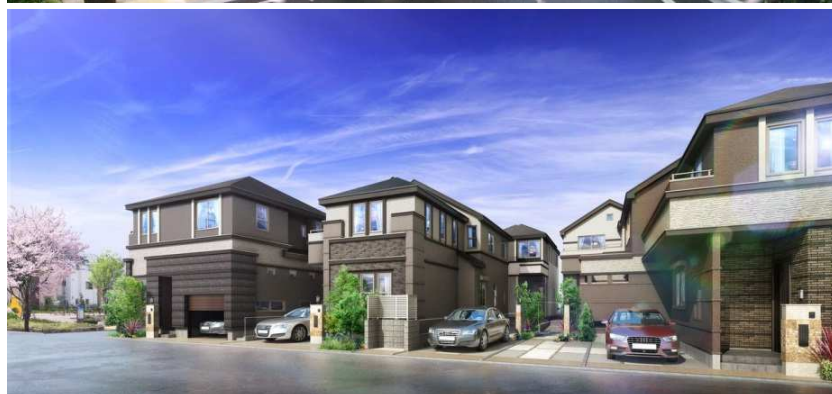
アリオンテラス瑞江（外観完成予想図）