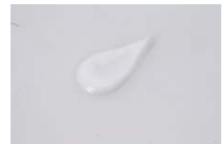
テクスチャー画像

成分 : 水、グリセリン、シア脂、テトラエチルヘキサノールペンタエリスリチル、エタノール、オクテニルコハク酸デンプンA1、プロパンジオール、オクチルドデカノール、ポリアクリルアミド、水添ポリイソブテン、(アクリル酸ヒドロキシエチル/アクリル酸メトキシエチル)コポリマー、フェノキシエタノール、ラウレス-7、メチルパラベン、ビスステアリルPEG/PPG-8/6(SMDI/PEG-400)コポリマー、(C12, 13)パレス-23、(C12, 13)パレス-3、BG、アセチルヒアルロン酸Na、テトラヘキシルデカン酸アスコルビル、加水分解ヒアルロン酸、イチョウ葉エキス、ゲンチアナ根エキス、コメヌカエキス、アルテア根エキス、セイヨウハッカ葉エキス、セージ葉エキス、ヒアルロン酸Na、チャ葉エキス、アロエベラ葉エキス