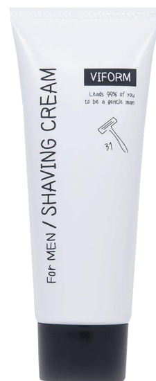
VIFORM(ヴィフォーム)シェービングクリーム

近年では、男性がスキンケアをし、肌をキレイにしたいと思うことが一般的になってきました。しかし男性は、日々の髭剃りによって肌の表面を傷つけやすく、出血や乾燥など肌トラブルで悩むことが多々あります。キレイに髭を剃るためには、シェービングアイテムを塗ってT字のカミソリでケアすることがオススメです。しかし、市販で販売されているジェルタイプや泡タイプを使用すると、“ヒリヒリして赤くなる”や、“乾燥により粉がふく”など、商品に満足していない方も。そこで、自然派男性化粧品「VIFORM（ヴィフォーム）」シリーズから、スキンケアしながら逆剃りもできるシェービングクリームを開発いたしました。