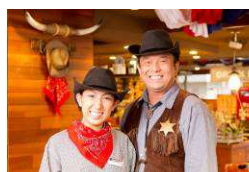
カウボーイ・カウガールが明るくお出迎え

今後も質の高い肉料理や充実したサラダバーを提供し、我が家のホームパーティーにお招きしたようなサービスで、地域の皆様に楽しんでいただけるレストランとなるよう努めてまいります。