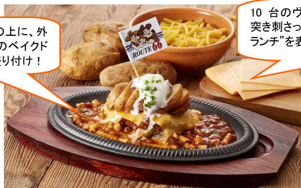
第5弾メニュー テキサス州「アマリロ チャックワゴン」 1,649円(税込1,780円) ※サラダバー付

大地に見立てたチーズの上に、外はカリッと中はホクホクのベイクドポテト(キャデラック)を盛り付け！