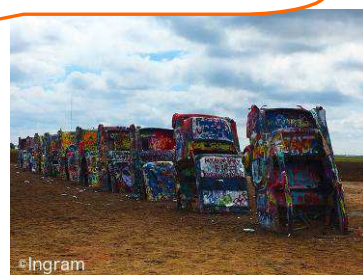
＜イメージ＞キャデラックランチ

10台のヴィンテージのキャデラックが地面に突き刺さってそびえる観光スポット“キャデラックランチ”を表現