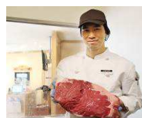
肉は、コックが1枚ずつ丁寧に店内でカット