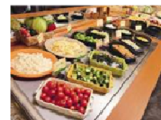
20種類以上楽しめるサラダバー