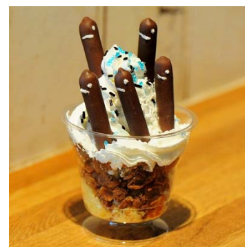
「ポッキーミディ」とチンアナゴのコラボレーションパフェ

販売期間:2016年11月1日(火)～11月30日(水) ※各日11個限定 販売場所:ハーベストカフェ 価 格:500円(税込み)