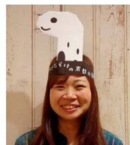
名前入りのオリジナルお面 (イメージ)