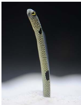
11月11日は「チンアナゴの日」 数字の1にそっくりなチンアナゴ

「京都水族館」(京都市下京区、館長:下村 実)は、数字の1に形がそっくりな人気のいきもの「チンアナゴ」や「ニシキアナゴ」を京都水族館の4周年に合わせて444匹の展示や体験プログラム、期間限定メニューなどでお楽しみいただける「ちんあなごだらけの京都水族館」を2016年11月1日(火)～11月30日(水)の期間に開催しますのでお知らせします。