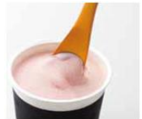
アイスクリームスプーン 972円(税込)

アルミ製の為、一般的なステンレス製スプーンに比べ熱伝導率がよく、固いアイスクリームも伝わる体温で溶かすことができます。先端部は、カップの底まですくいきやすいように平らになっており、また斜めになっているので、尖った部分で硬いアイスもしっかりたっぷりすくうことができます。