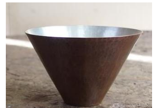
直カップ(小)16,200円(税込)