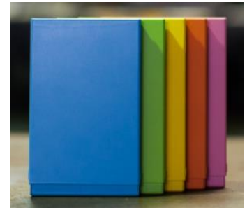
マグネシウム名刺入れ 各7,560円(税込)