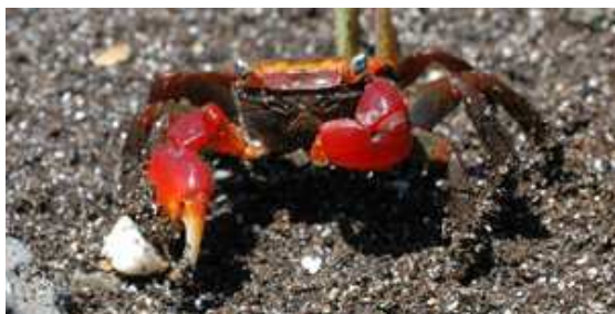
アカテガニ [相模湾ゾーン／川魚のジャンプ水槽横]

地球と月が作り出すリズムは、生きものたちの最大の見せ場を演出します。沖縄のサンゴ、相模湾のアカテガニやクサフグなど、時期や場所は異なりますが、これらの生物は、新月や満月といった月の満ち欠けの影響を受けて、産卵を始めるのです。