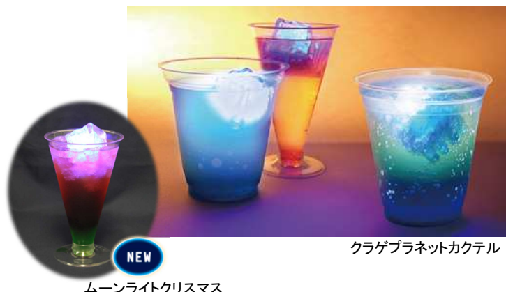
ムーンライトクリスマス