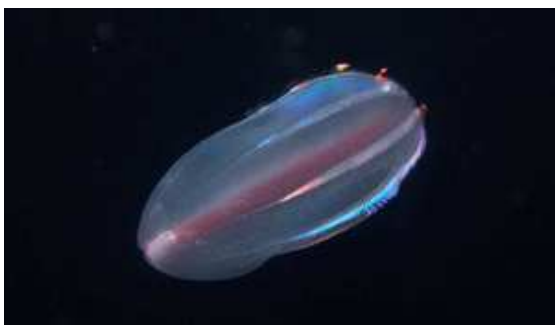
クシクラゲの仲間 [クラゲサイエンス]

海には光る生物たちがたくさんくらしています。光る理由は、お互いのコミュニケーションのため、危険から身を守るため、餌をおびき寄せるためなどさまざまです。光る仕組みもバクテリアによる発光や反射など、種類によって異なります。