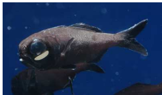
ヒカリキンメダイ [太平洋]