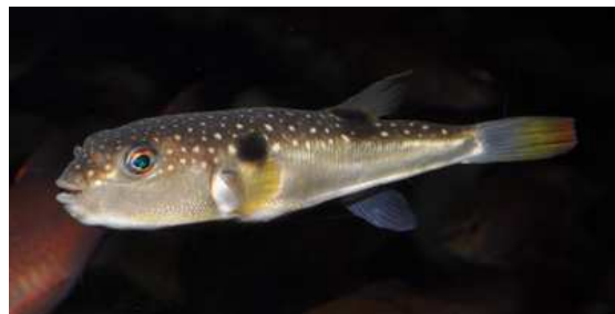
クサフグ [相模湾ゾーン／潮溜まり(タイドプール)]