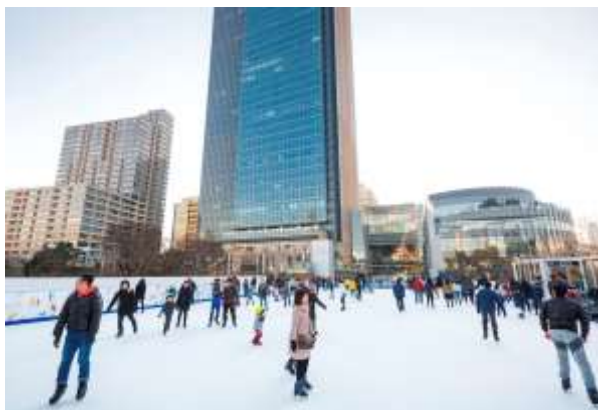
昨年のアイスリンクの様子

スポーツには暮らす人々や働く人々、憩う人々の心身を健康にするだけでなく、新しいつながりを生みだし、コミュニティを活性化する力があります。当社は、スポーツを魅力的な街をつくる上で重要な要素と捉え、「スポーツの力」を活用した街づくりを推進していきます。また、当社は今後も日本橋や湾岸エリア、当社が全国で運営するらぽーとや三井アウトレットパークなどの場の活用を通してアスリートを応援し、街とオリンピック・パラリンピックムーブメント双方の盛り上げを図るなど、東京2020ゴールド街づくりパートナーとして大会の成功に貢献してまいります。