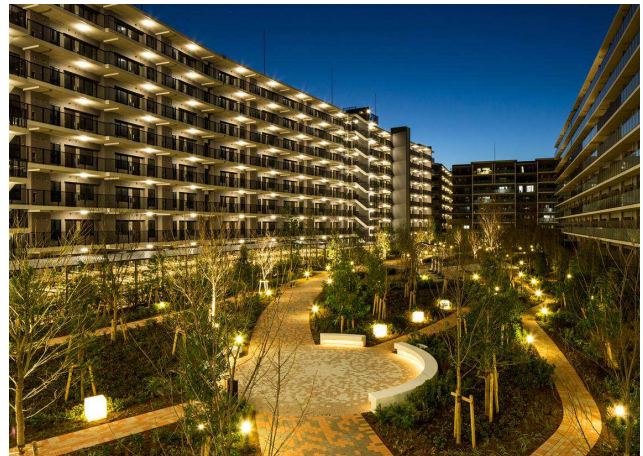
広大な敷地内には約 300 本以上の樹々が彩る 「ザ・シーズンズ グランアルト越谷レイクタウン」