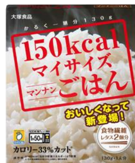
【マイサイズ マンナンごはん】