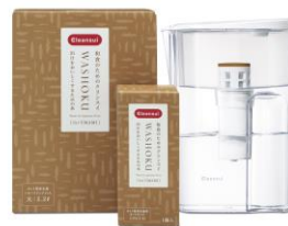
出汁をおいしくするためのポット型浄水器