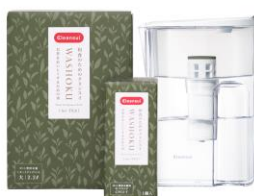
お茶をおいしくするためのポット型浄水器