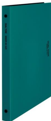
グリーン×ブラック