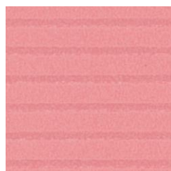
外表紙:エンボス加工