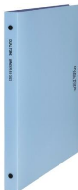
ライトブルー×ブルーグレー